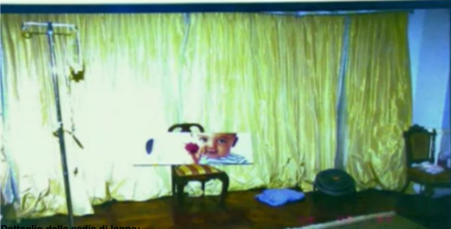
Dettaglio della sedia di legno: