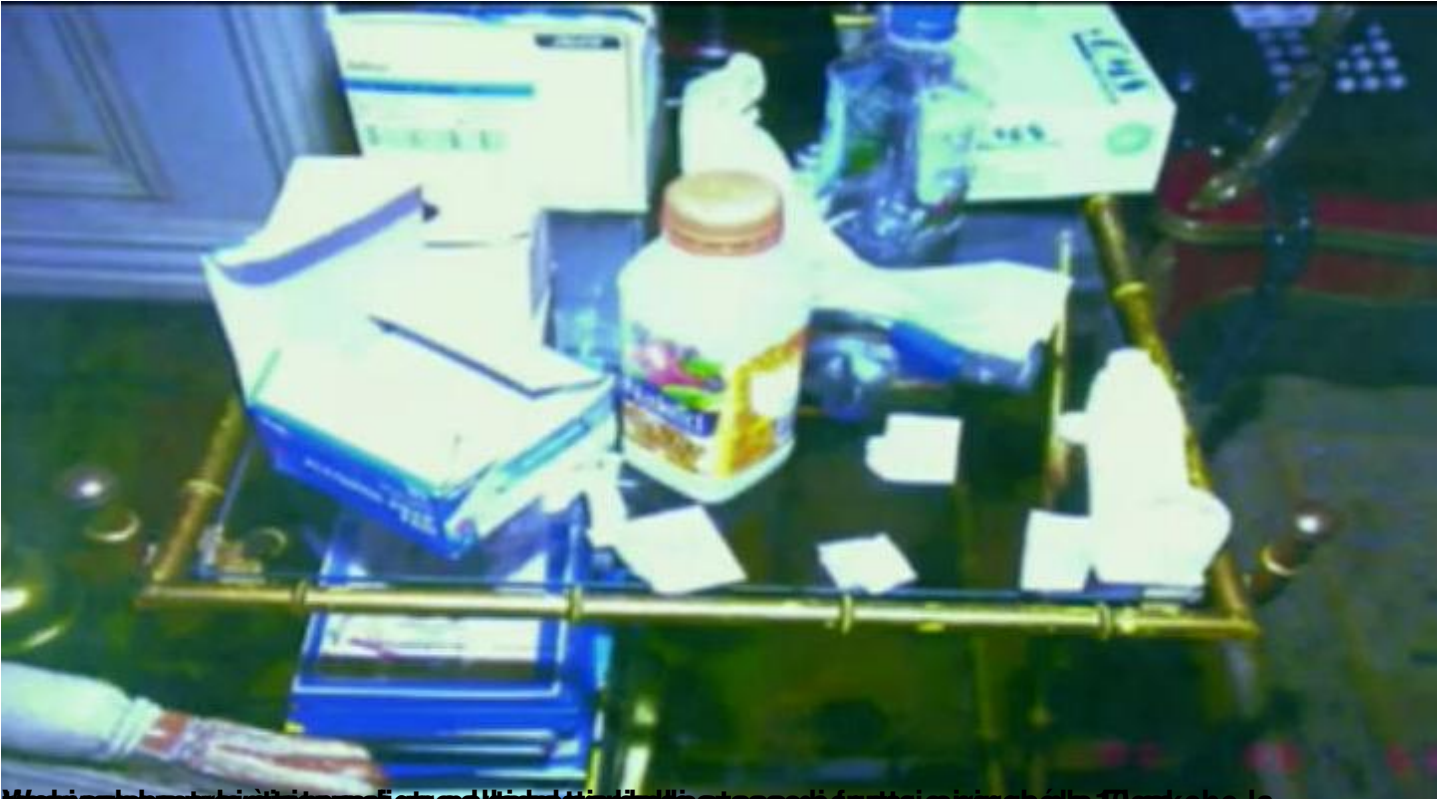
Medicine cabinet, bin, and supplies on the medical cart that was used to transport the patient to the ER. Fleak che la