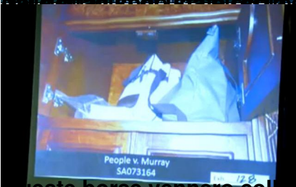
Queste borse vennero collocate su un tavolino come nella foto scattata dalla Fleak: