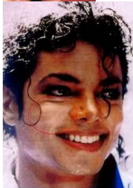
foto che mostrano molto chiaramente la vitiligine di Michael